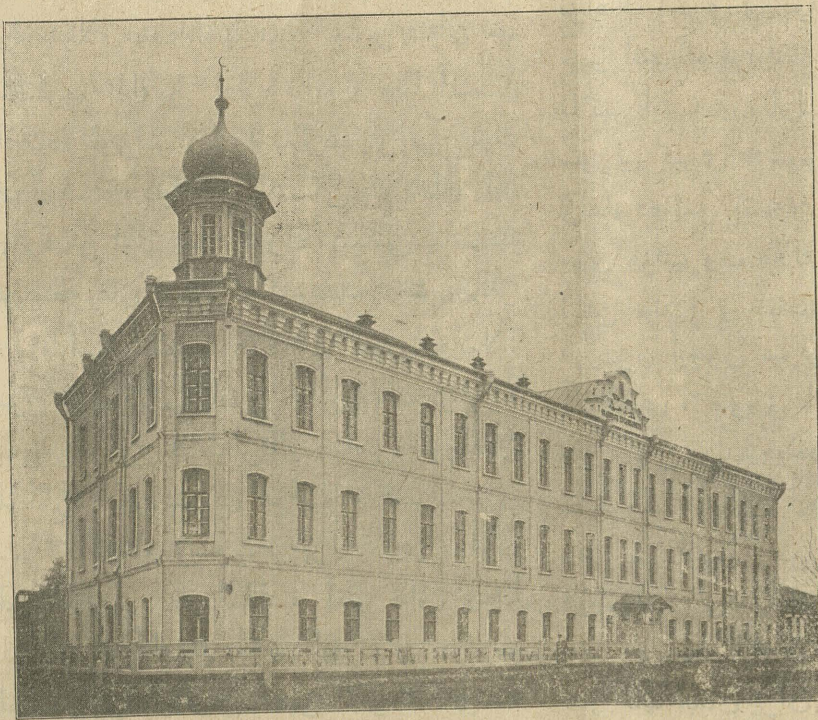
« اورنبورغده مدرسه حسینیہ »

صوم مصرف طو تلمشدر. مدرسه ده اوقولا طورغان فنلر: لسان ترکی، خط و املا، قران تجوید ایله، لسان عربی، لسان روسی، لسان فارسی، اخلاق حساب، جغرافیا، بلاغت عربیه، ادبیات ترکیه، تاریخ، هندسه، علم حیوانات، حفظ صحت، حکمت طبیعه، کیمیا، منطق، کلام، فقه، اصول فقه، حدیث،