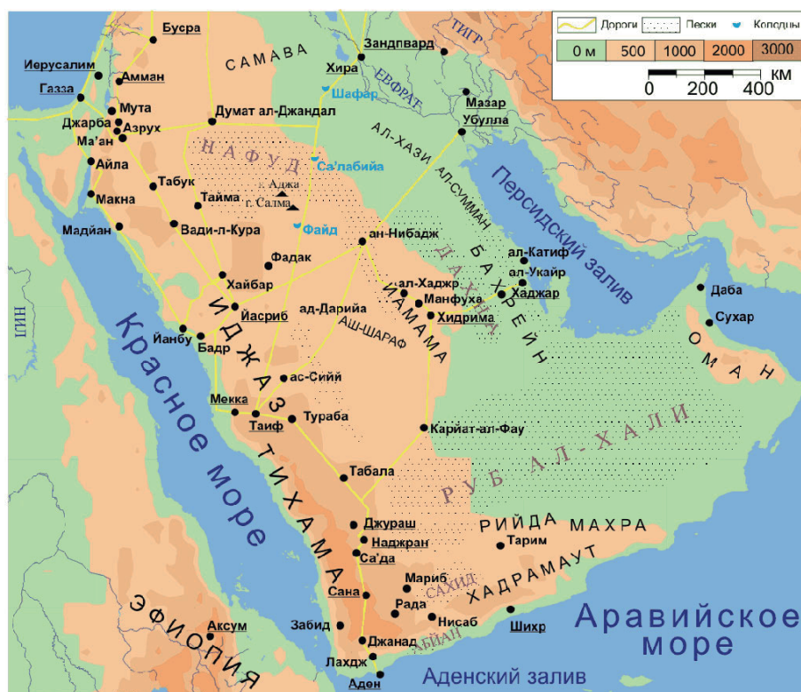
Map created for Gumilevica - A Rodionov

Аравийский полуостров замкнут в виде треугольника тремя горными цепями. Две из них тянутся с севера на юг, расходясь одна в юго-западном, а другая – в юго-восточном направлении. Первая есть продолжение гор Ливана и Антиливана и простирается под именем Хиджазских и Йеменских гор от Синайского полуострова вдоль всего берега Красного моря до самого Баб-эль-Мандебского пролива. Непосредственно прибрежная низкая ее полоса называется Тихама.