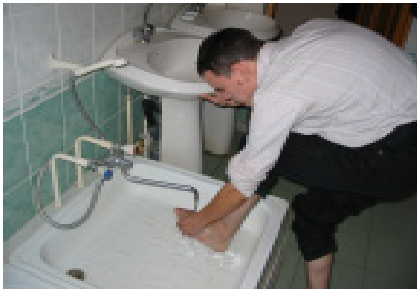
Сул аякны бармак аралары вә тубыклары илә юмак