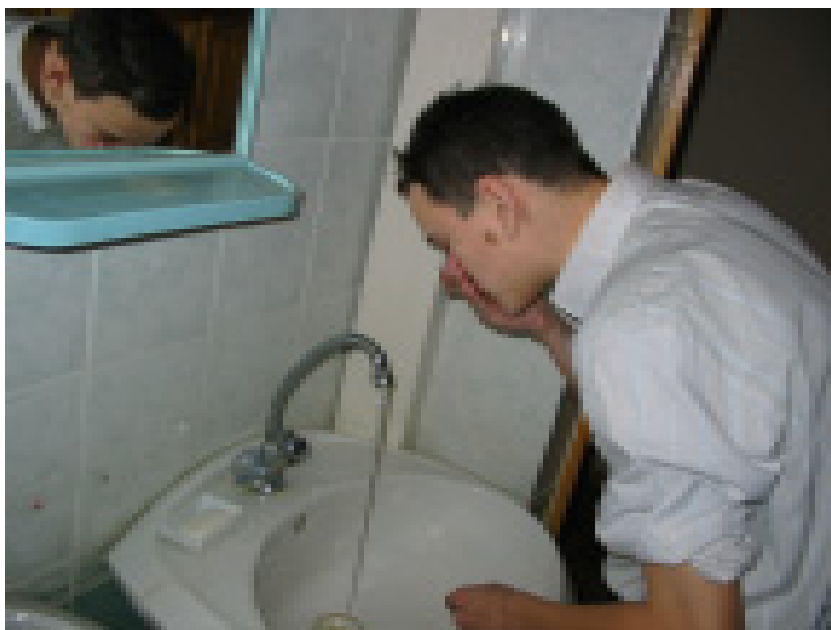
Борынны юып сеңгермәк