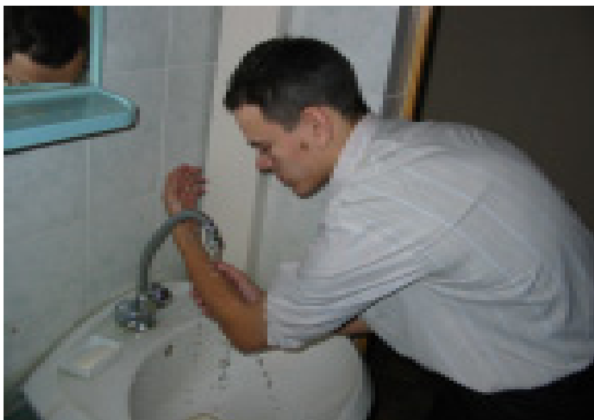
Сул кулын терсәкләре белән юмак