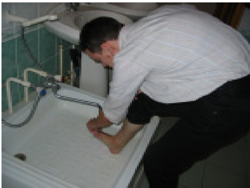
Уң аякны бармак аралары вә тубыклары илә юмак