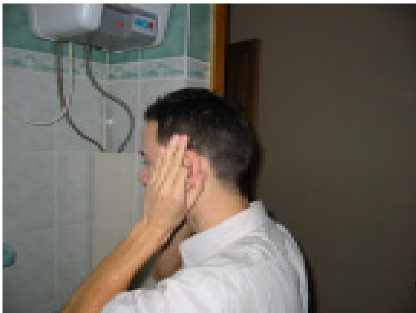
Колактарны чыланган кул белән сөртмөк