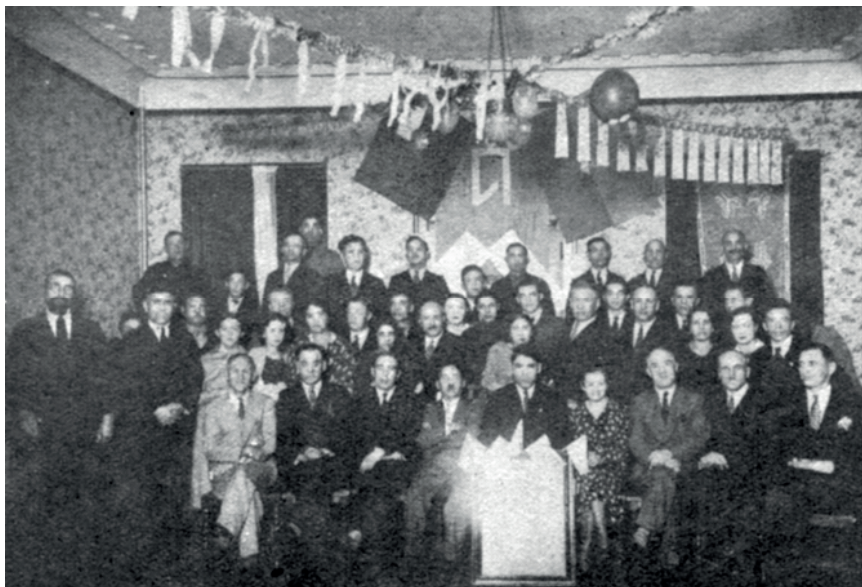
«Зыяфәттән соң. Шанхайда». (Милли байрак. – 1937 ел, 23 апрель).

Мөшһүр әдибәбез вә бөек юлбашчыбыз Гаяз әфәнде Исхакый жәнабләренәң туган көне һәм әдип уларак кырык ел хезмәт итүенәң юбилейсе Шанхай төрк-татарларының Дини-милли идарәсе һәм Мәдәният жәмгыяте идарәсе тарафыннан аерым тантаналы рәвештә үткәрелде. Бу хосуста, Шанхайда чыга торган әжнәби гәзитәләрендә хәбәр ителүдән башка, Шанхайда яшәүче илдәшләргә дә аерым дөгъвәтнамәләр таратылган иде.